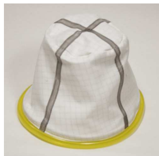
メイン布フィルター