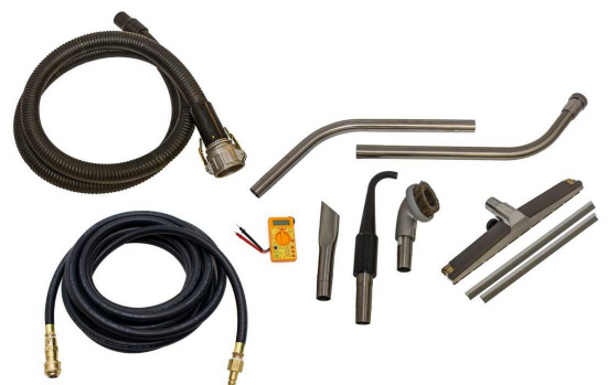
標準付属ツールキット