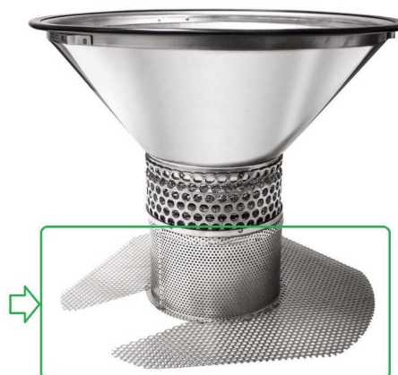
回収バッグ押さえケージ

ご注意：この掃除機は爆発の危険性が常時存在しない領域（Zone22）のみで使用可能です。